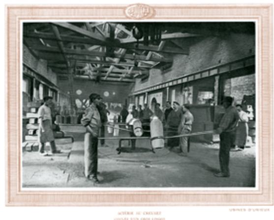
Coulée d'un gros lingot à l'aciérie Holtzer