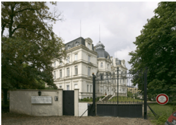
Le château Dorian à Fraisses où séjourna Émile Zola en 1900

Ce n'est qu'en 1900 qu'il effectua un court séjour dans notre région 2 . Logé au château Dorian à Fraisses par ses amis Ménard-Dorian, il visita l'aciérie Holtzer d'Unieux afin de se documenter pour l'écriture de son œuvre Travail parue en 1901. Appartenant à la tétralogie Les Quatre Évangiles , ce roman est le dernier publié du vivant de Zola.