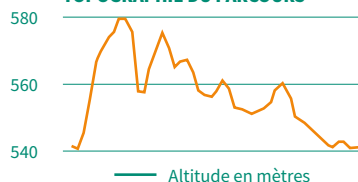
TOPOGRAPHIE DU PARCOURS