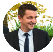
Gaël Perdriau Maire de Saint-Étienne Président de Saint-Étienne Métropole

Ces interventions variées ont conduit à un embellissement et un changement d'image des quartiers qui deviennent progressivement plus agréables à vivre et plus attractifs. À chacun d'investir tous ces espaces afin de construire ensemble le meilleur commun pour aujourd'hui et pour demain.