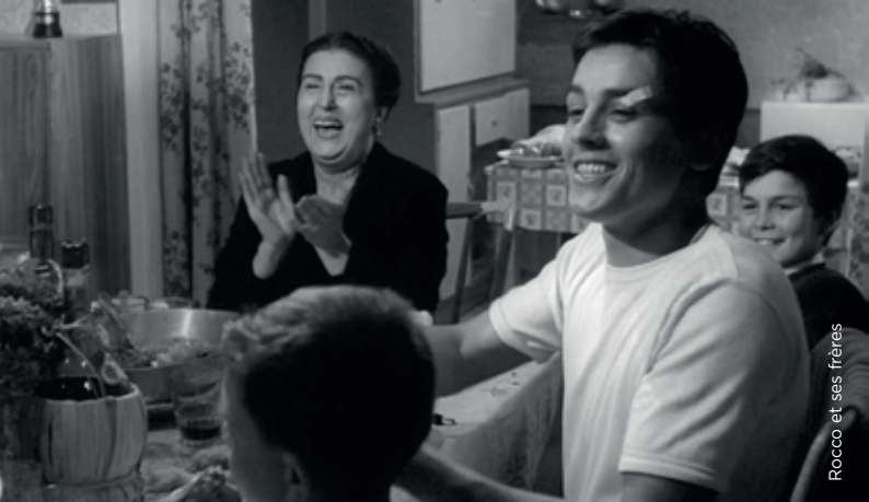
Rocco et ses frères