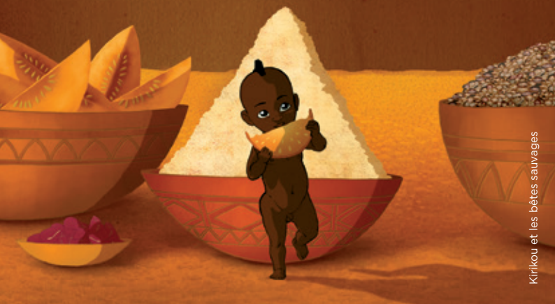
Kirikou et les bêtes sauvages